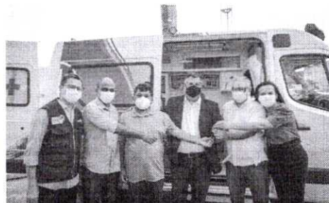
Esta é a 380ª ambulância entregue pelo Governo do Estado.