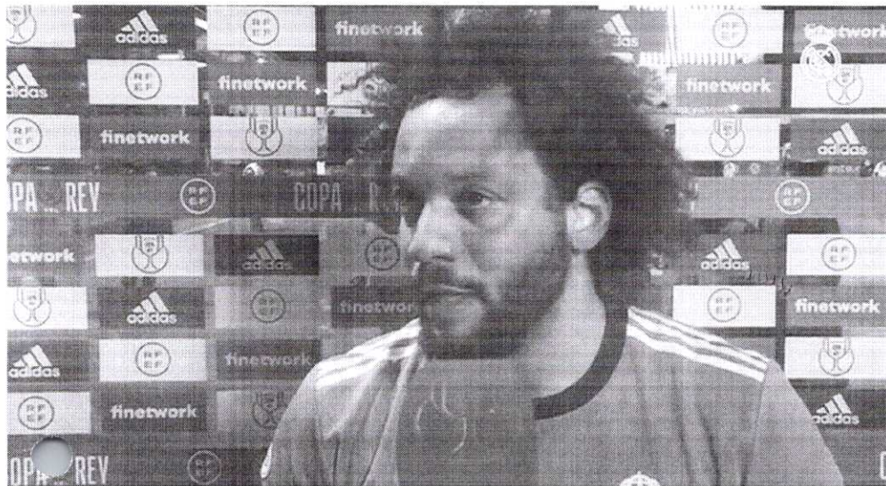
Marcelo, lateral-esquerdo do Real Madrid