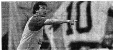
Fernando Diniz na Vila Belmiro quando comandava o São Paulo