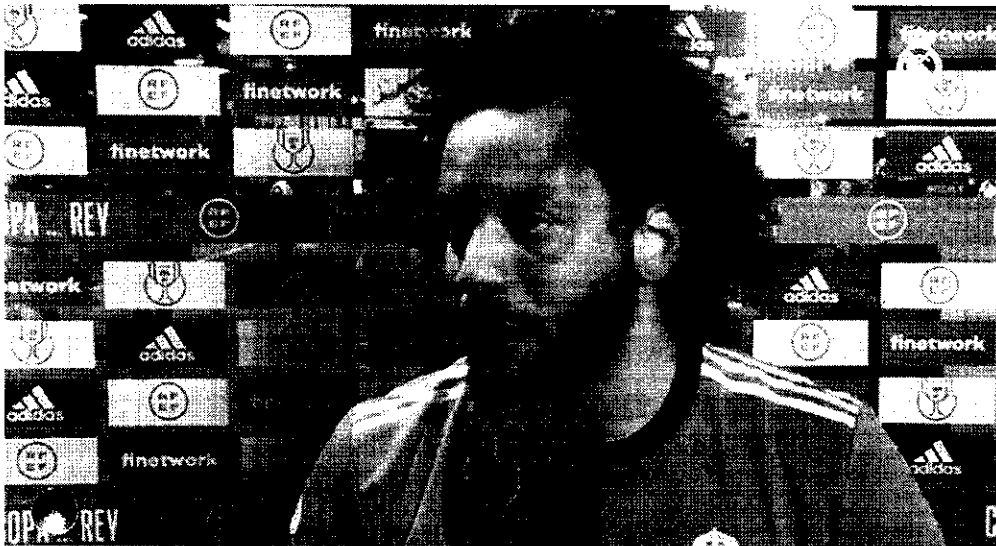
Marcelo, lateral-esquerdo do Real Madrid