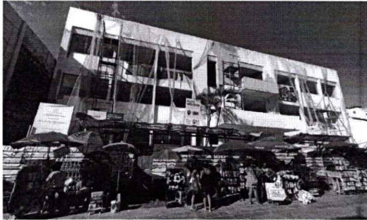
O shopping terá um andar para a difusão e valorização da cultura maranhense

Ao todo, serão gerados 72 empregos diretos. Ficarão aberto em horário de shopping, das 9h às 21h (12 horas por dia), de segunda-feira a sábado. Aos domingos, funcionará das