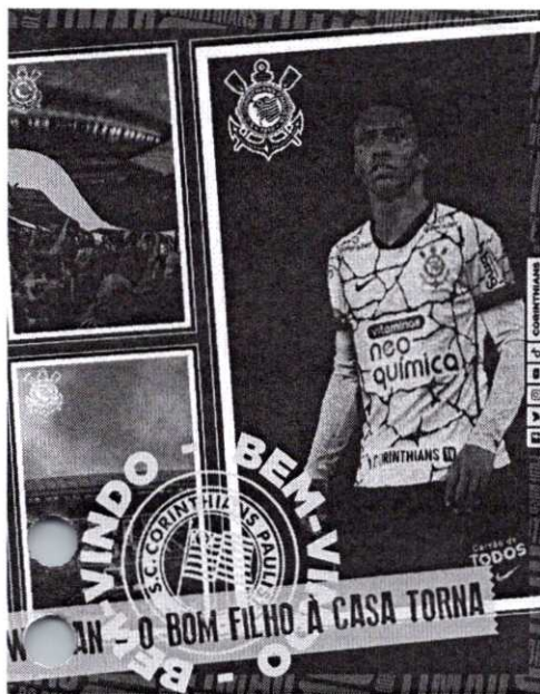
Corinthians anuncia Willian