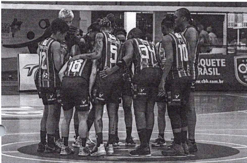
Guerreiros do Sampaio comemoraram a classificação para a semifinal

Com muito equilíbrio, em um jogo decidido nos últimos instantes, o Sampaio Basquete garantiu a passagem para as semifinais da LBF 2021. Nesta sexta-feira (23/7), o tricolor maranhense venceu novamente o Santo André/Apaba por 67 a 64, desta vez em casa, no ginásio Costa Rodrigues, em São Luís (MA), fechou a série das quartas de final em