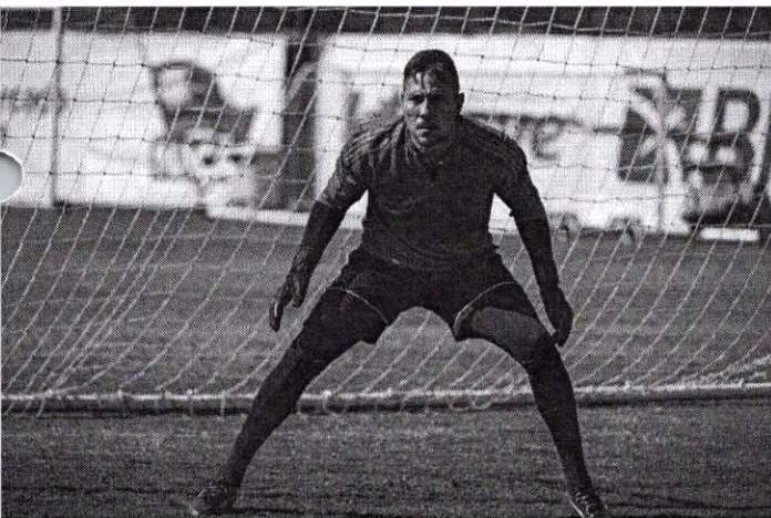
Diego Alves no treino desta terça, no Ninho do Urubu