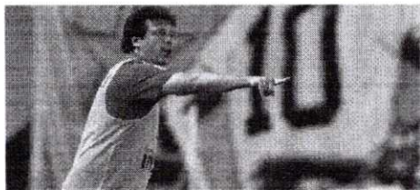
Fernando Diniz na Vila Belmiro quando comandava o São Paulo