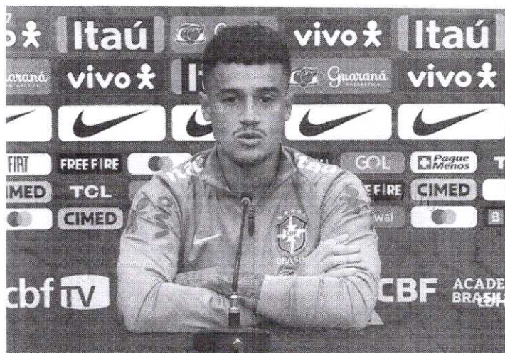
Philippe Coutinho concedeu entrevista coletiva na seleção brasileira

— Fiquei meio surpreso quando cheguei em casa e vi algumas notícias. Na minha vida nunca faltei com profissionalismo. Sempre respeitei a todos, com todo mundo que trabalhei. Mas tudo bem, respeito a opinião de vocês jornalistas. Falando sobre a convocação, estou muito feliz, tenho muita vontade de estar de volta. Venho com a cabeça no trabalho, focado no trabalho, para poder conquistar as coisas mediante ao trabalho,