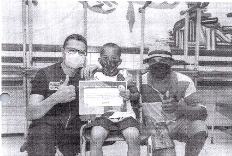
Governo promove vacinação de crianças na Cidade Olímpica

O Governo do Estado, por intermédio da Secretaria de Estado da Saúde (SES) realizou, neste sábado (5), ação de vacinação de crianças e adolescentes contra a Covid-19, no Centro Educa Mais Padre José Bráulio Sousa Ayres, bairro da Cidade Operária. A iniciativa teve como objetivo fortalecer a imunização do público de 5 a 17 anos contra a doença em São Luís.