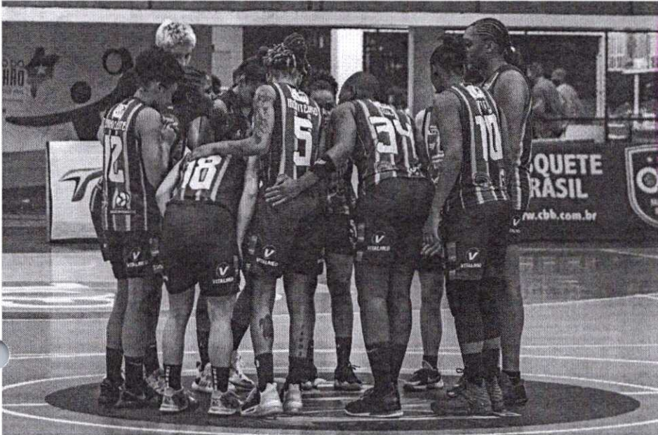
Guerreiras do Sampaio comemoram a classificação para a semifinal

Com muito equilíbrio, em um jogo decidido nos últimos instantes, o Sampaio Basquete garantiu a passagem para as semifinais da LBF 2021. Nesta sexta-feira (23/7), o tricolor maranhense venceu novamente o Santo André/Apaba por 67 a 64, desta vez em casa, no ginásio Costa Rodrigues, em São Luís (MA), fechou a série das quartas de final em