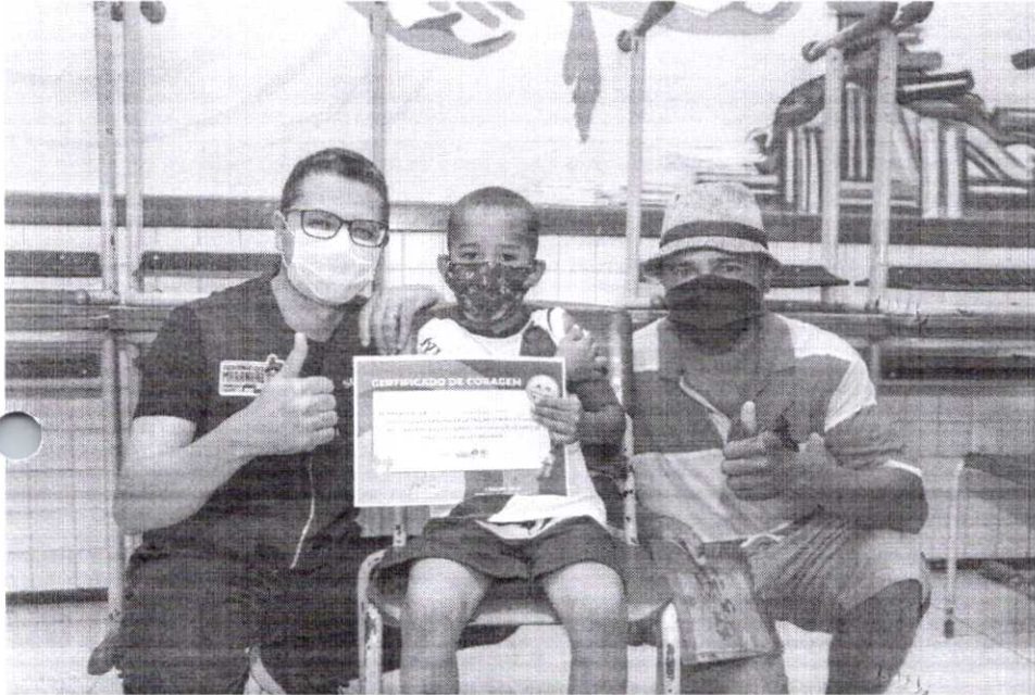
Governo promove vacinação de crianças na Cidade Olímpica

O Governo do Estado, por intermédio da Secretaria de Estado da Saúde (SES) realizou, neste sábado (5), ação de vacinação de crianças e adolescentes contra a Covid-19, no Centro Educa Mais Padre José Bráulio Sousa Ayres, bairro da Cidade Operária. A iniciativa teve como objetivo fortalecer a imunização do público de 5 a 17 anos contra a doença em São Luís.