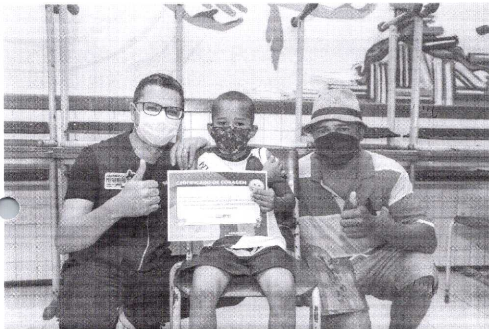
Governo promove vacinação de crianças na Cidade Olímpica

O Governo do Estado, por intermédio da Secretaria de Estado da Saúde (SES) realizou, neste sábado (5), ação de vacinação de crianças e adolescentes contra a Covid-19, no Centro Educa Mais Padre José Bráulio Sousa Ayres, bairro da Cidade Operária. A iniciativa teve como objetivo fortalecer a imunização do público de 5 a 17 anos contra a doença em São Luís.